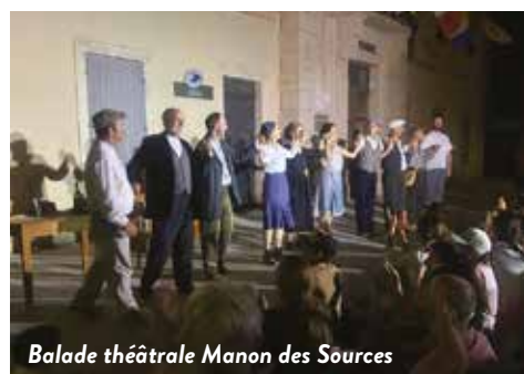
Balade théâtrale Manon des Sources