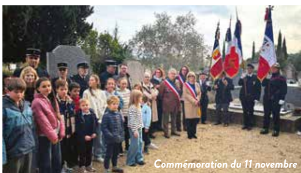
Commémoration du 11 novembre