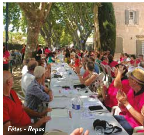
Fêtes - Repas