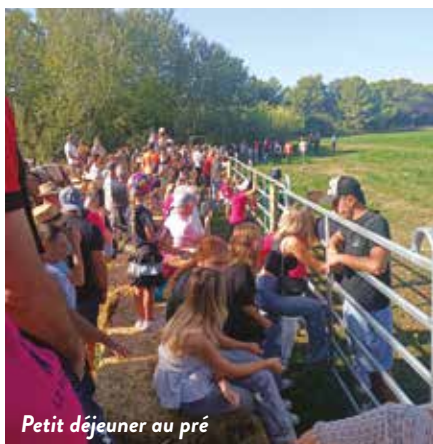
Petit déjeuner au pré