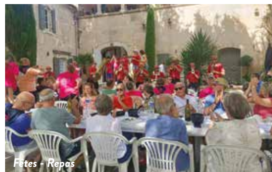
Fêtes - Repas