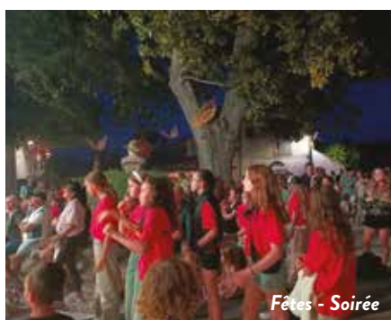
Fêtes - Soirée