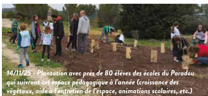
14/11/25 - Plantation avec près de 80 élèves des écoles du Paradou qui suivront cet espace pédagogique à l'année (croissance des végétaux, aide à l'entretien de l'espace, animations scolaires, etc.)

* HERE Technologies est un éditeur de logiciels de planification d'itinéraires et de cartographie en ligne. Il publie notamment le service HERE WeGo.