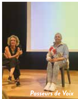
Passeurs de Voix