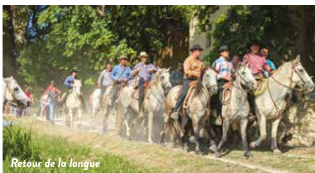
Retour de la longue