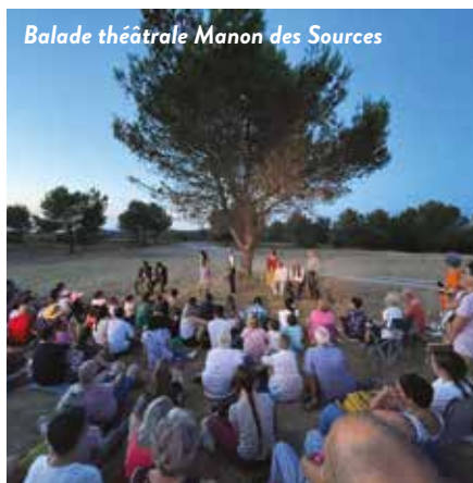
Balade théâtrale Manon des Sources