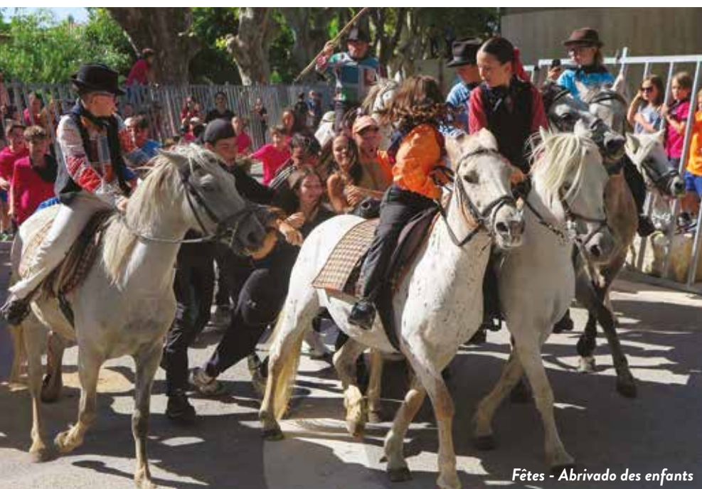
Fêtes - Abrivado des enfants