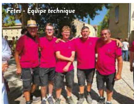
Fêtes - Équipe technique