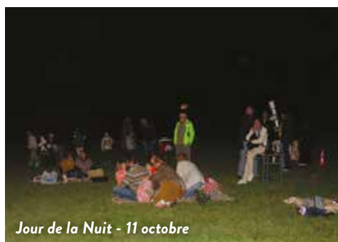
Jour de la Nuit - 11 octobre