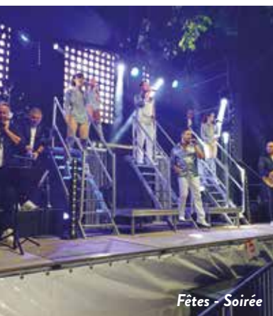
Fêtes - Soirée