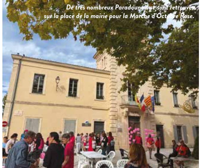
De très nombreux Paradounais se sont retrouvés sur la place de la mairie pour la Marche d'Octobre Rose.