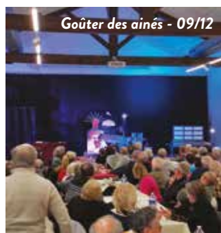
Goûter des aînés - 09/12