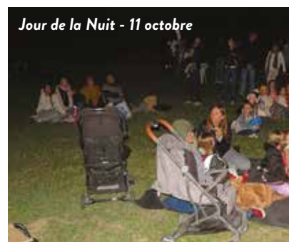
Jour de la Nuit - 11 octobre