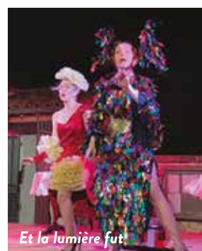
Et la lumière fut