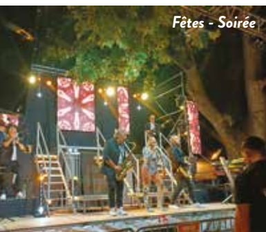
Fêtes - Soirée