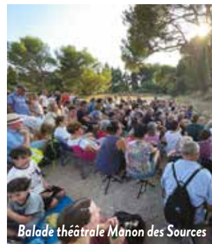
Balade théâtrale Manon des Sources