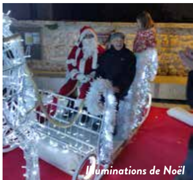
Illuminations de Noël