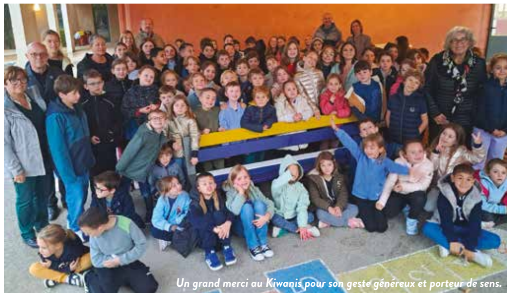
Un grand merci au Kiwanis pour son geste généreux et porteur de sens.