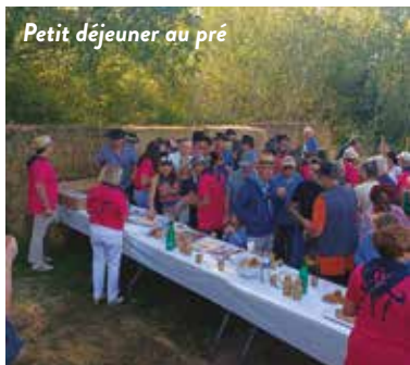
Petit déjeuner au pré