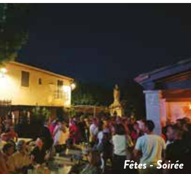
Fêtes - Soirée