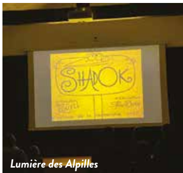
Lumière des Alpilles